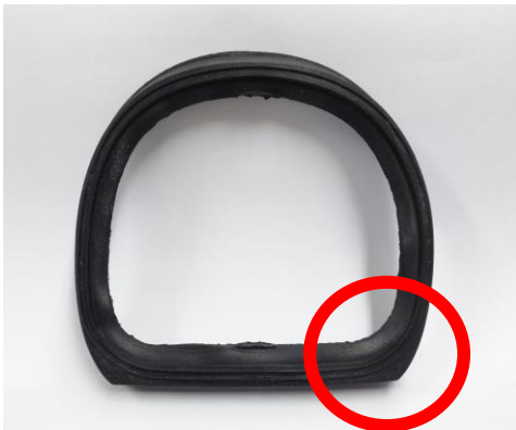
吸い込み口側から見た図

FC-700/800のフィルター枠に取り付けるパッキンには向きがありますので、お間違えのないように取り付けていただきますよう、お願い申し上げます。