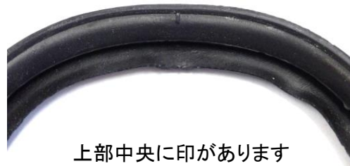
上部中央に印があります