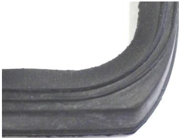
線が2本入っています