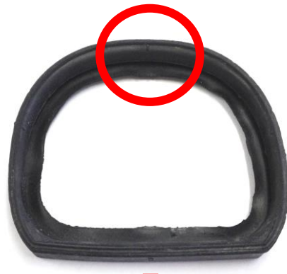
本体(スイッチ)側から見た図